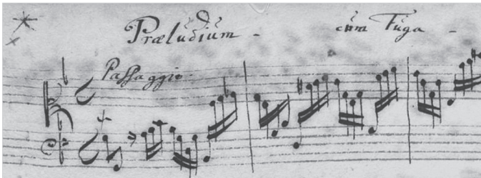
Abbildung 1: Möller-Manuskript, f. 44r, Beginn von BWV 535.

Der Begriff des Passaggio im Sinne von »geschwinde Läufe« 7 für den improvisatorischen Einstieg in das Präludium lässt sich bei Buxtehude selbst nicht nachweisen, tritt jedoch beim jungen Johann Sebastian Bach auf. In der sog. Möller'schen Handschrift aus der Zeit um 1705 8 findet sich unter den wenigen erhaltenen frühen autographen Niederschriften Bachs die Aufzeichnung des Präludiums in g (BWV 535). Dort trägt die ausgedehnte einstimmige manualiter -Passage zu Beginn des Werkes, die mit dem pedaliter -Akkord in Takt 7 ihren Abschluss findet, von der Hand Bachs die Bezeichnung »Passaggio« (Abb. 1):