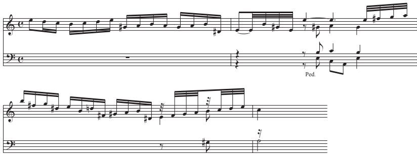
Notenbeispiel 1a: BuxWV 152, Passaggio zu Beginn

Der Begriff des Passaggio im Sinne von »geschwinde Läufe« 7 für den improvisatorischen Einstieg in das Präludium lässt sich bei Buxtehude selbst nicht nachweisen, tritt jedoch beim jungen Johann Sebastian Bach auf. In der sog. Möller'schen Handschrift aus der Zeit um 1705 8 findet sich unter den wenigen erhaltenen frühen autographen Niederschriften Bachs die Aufzeichnung des Präludiums in g (BWV 535). Dort trägt die ausgedehnte einstimmige manualiter -Passage zu Beginn des Werkes, die mit dem pedaliter -Akkord in Takt 7 ihren Abschluss findet, von der Hand Bachs die Bezeichnung »Passaggio« (Abb. 1):