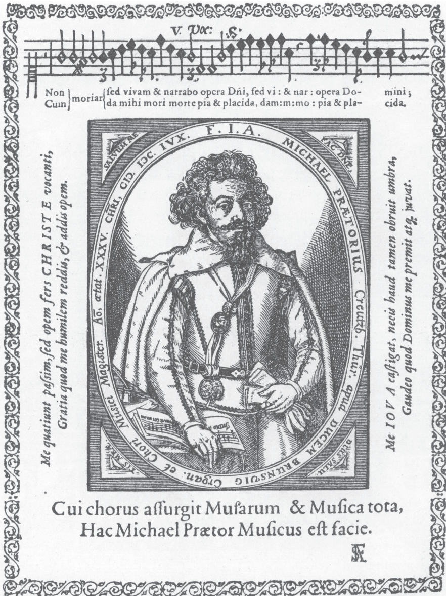
Holzschnitt B: Generaltitelblatt Musae Sioniae , 1606 Portraitholzschnitt als Frontispiz (Abb. 2)