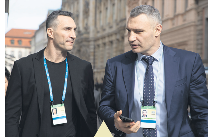
Брати Клички на Конференції з безпеки у Мюнхені домовлялися про допомогу Україні та повоєнне відновлення. Читайте на стор 4