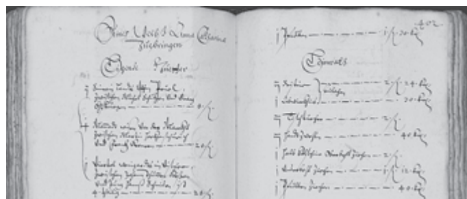
Auszug aus Inventur, Metzlingen, 1655

Eine vorherige Anmeldung zu der digitalen Archivsprechstunde ist nicht erforderlich. Der Link zum Webex-Meeting ist auf der Internetseite www.kultur-machen.de/archivsprechstunde hinterlegt und lautet: https://kreis-reutlingen/j.php?MTID=mee932603014df7a9adc9be511ffc94d Interessierte, die sich bereits vorab mit dem Thema beschäftigen möchten, finden ergänzend einen vertiefenden Vortrag im YouTube-Kanal des Landesarchivs Baden-Württemberg: https://www.youtube.com/watch?v=FBUPY-a6LqU