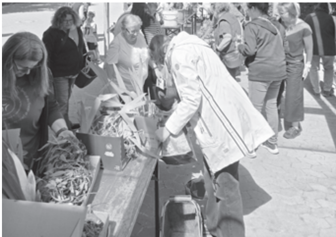
Großes Interesse bei der „Pflanzentauschbörse“ der Landfrauen Hülben.