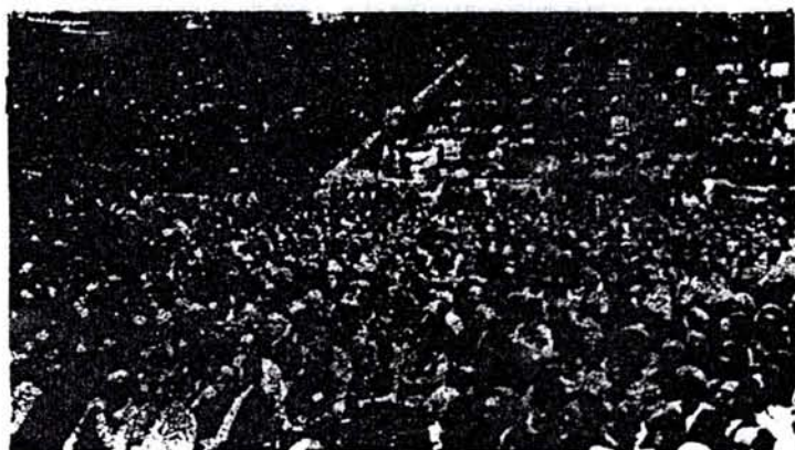
UNA ASAMBLEA CONSTITUYENTE CON AMPLIA Y LIBRE PARTICIPACION POPULAR, CONTARIA CON EL PLENO APOYO DE LOS TRABAJADORES.

Pero por sobre estas cuestiones que limitan e invalidan la convocatoria en su aspecto concreto, la medida del gobierno es en los hechos, un indirecto reconocimiento de la caducidad no ya del elenco gobernante, sino de la organización del país mismo, es decir del sistema capitalista que ha servido