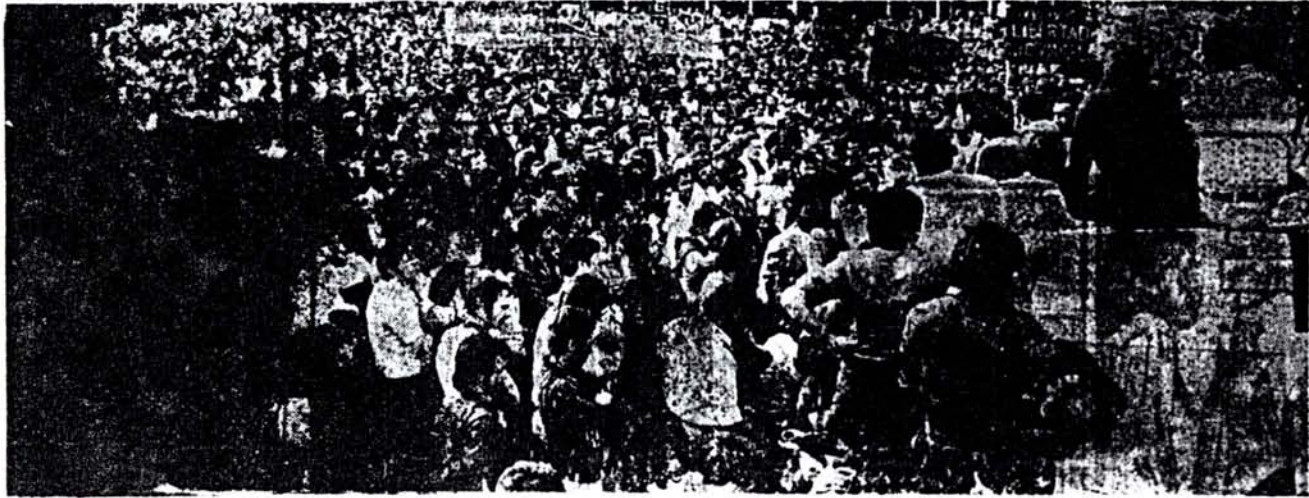
Vista parcial de la multitudinaria asamblea del viernes 31, en Santa Isabel.

lizadas ante SMATA nacional. Luego de una democrática deliberación, la Asamblea resolvió reafirmar a la Interfabril, darle mandato para que se haga cargo del sindicato hasta que se realice la devolución del mismo, reafirmar que el prometido aumento del 40 o/opa para el SMATA es independiente de los aumentos salariales que puede otorgar además el gobierno, dar un plazo de 20 días para que se ponga en libertad a los detenidos del gremio y declarar la total solidaridad