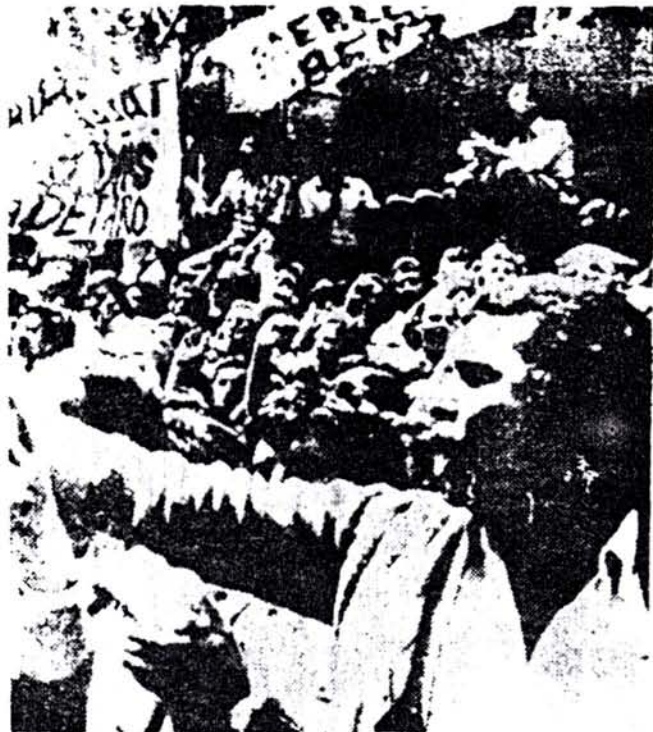
El triunfo de Mercedes Benz marca el camino de la lucha por el salario.

La crisis, entonces, no difiere de otras en sus rasgos principales, sino en la profundidad que ya ha cobrado y que tiende inevitablemente a acentuarse en los meses venideros. Un factor más contribuye a multiplicar las dificultades de la burguesía dependiente argentina: el imperialismo, a escala mundial, atraviesa por uno de sus momentos más críticos, volcando sobre los países más atrasados, subordinados a su dominación económica y técnica, una parte considerable de sus quebrantos. El cierre de mercados tradicionales para la colocación de productos argentinos (carne, cereales, frutas, etc.), por un lado, y el aumento