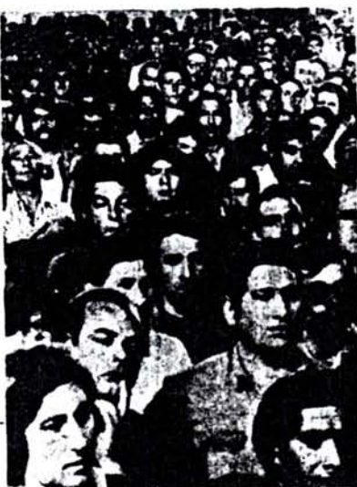
Asamblea de Astilleros (abajo) y mineros en huelga de Sierra Grande (derecha).

Empleados de las oficinas centrales de YPF iniciaron una huelga de brazos caídos exigiendo incrementos salariales para hacer frente al alza del costo de la vida. Los 5.000 empleados que allí se desempeñan realizaron una asamblea, oportunidad en la que dirigentes sindicales del SUPE fueron abucheados al tratar de desviar el eje de la lucha.