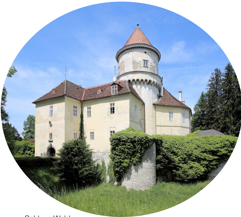
Schloss Wald

Geprägt von alter bäuerlicher Kultur, seinem markanten Schloss und der liebevoll renovierten Filialkirche, bewahrt Pyhra bis heute seinen ländlichen Charme und eine starke Dorfgemeinschaft. Hier genießt man Lebensqualität abseits vom Trubel, findet weitläufige Ausreit- und Wanderwege direkt vor der Haustür und erlebt authentisch das Beste des Weinviertels – ein idyllischer Flecken, der zu Entschleunigung und purem Wohlfühlen einlädt.