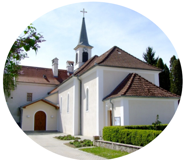
Pfarrkirche Pyhra