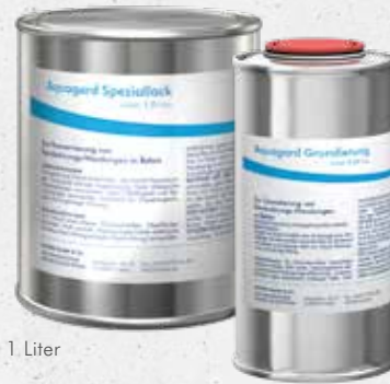
Liefergröße 1 Liter