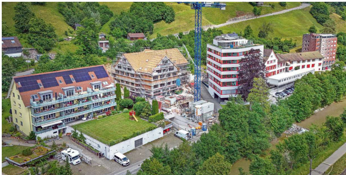
Das Pflegezentrum Bauma liegt auf dem Areal des ehemaligen Spitals. Neben dem Hochhaus wird der Trakt «Villa», der altershalber weichen musste, neu gebaut.

Es bietet tatsächlich etwas an, das der Staat nicht zur Verfügung stellt – es schliesst eine Lücke, und das System kann nicht darauf verzichten. Deshalb sind alle froh, und wo kein Kläger, da kein Richter. Doch wir sind nun mal ein Rechtsstaat, und als solcher müssen wir uns fragen: Reicht das? Das sollte unbedingt auf politischer Ebene geklärt werden – auch weil sich das Problem in Zukunft noch erheblich verschärfen wird. Unsere Insassen werden nämlich immer älter und damit auch pflegebedürftiger. Da rollt eine Welle auf uns zu. Die Kurve der über 60-jährigen Insassen steigt exponentiell an.