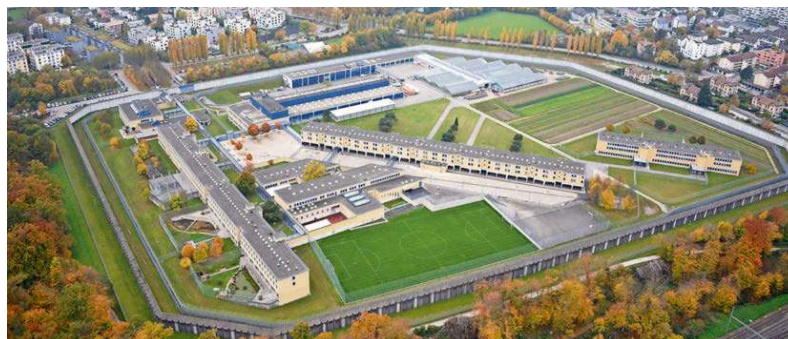
Die Justizvollzugsanstalt Pöschwies in Regensdorf soll ausgebaut werden – mit Fokus auf ältere und pflegebedürftige Insassen.

Ersetzen soll der Ausbau der Pöschwies das Pflegezentrum Bauma übrigens nicht. Der Bedarf an solchen Plätzen sei gross und könne vom Heim in Bauma heute nicht vollständig abgedeckt werden. Angesichts der Entwicklung des Bestands an Inhaftierten werde sich die Nachfrage weiter erhöhen. «Wir gehen davon aus, dass wir auch in Zukunft das Angebot des Pflegezentrums nutzen werden.»